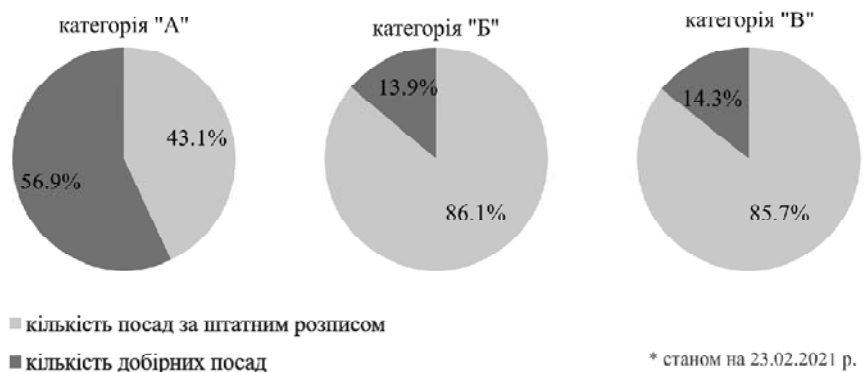
Рис. 2. Співвідношення кількості посад державних службовців призначених шляхом добору до кількості посад за штатним розписом

Крім того, слід зазначити, що система державних органів хоч і є складною та характеризується певними особливостями, однак це один інститут державної служби, який регулюється чітко законодавчо визначеними принципами державної служби. Тому надмірні особливості дер-