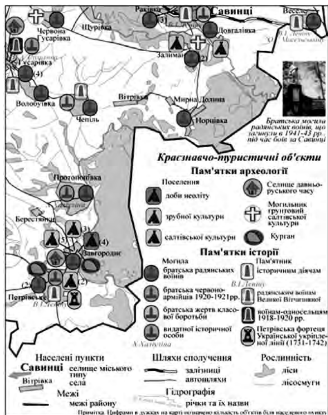
Рис. 2. Частина розвороту туристсько-краєзнавчого довідника (зменшено)

з подіями чи життям відомих людей, об'єкти природно-заповідного фонду, дати заснування населених пунктів або першої письмової згадки про них, об'єкти інфраструктури, що забезпечують розвиток туристсько-краєзнавчої діяльності в районі, а також районування території за ступенем привабливості. Поряд наводиться краєзнавча інформація про історію району, розповідається про його нинішнє життя. На наступних чотирьох розворотах довідника у масштабі 1:200 000 детально розглянуті туристсько-краєзнавчі ресурси (рис. 2):