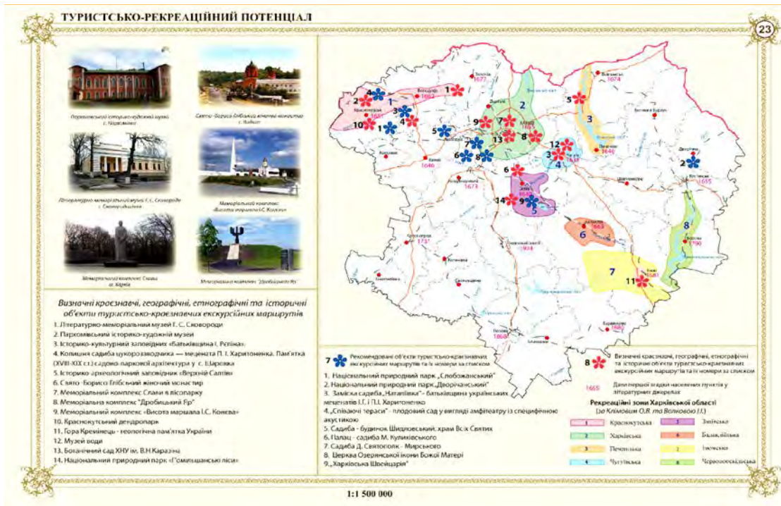
Рис. 4. Карта «Туристсько-рекреаційний потенціал» (розділ 3), зменшено в 2,5 рази

Масштабний ряд обирався, виходячи із призначення картографічного твору, зручності використання й територіального рівня картографічного моделювання: 1:15 000 000 (Україна) – 1:1 500 000 (Харківська область) – 1:250 000 (адміністративний район області).