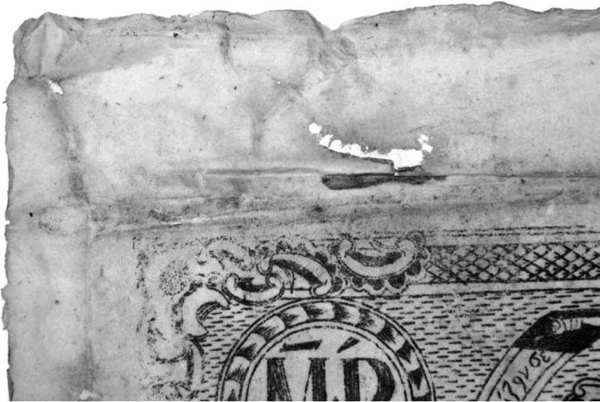
Іл. 3. Фрагмент гравюри з розгорнутими краями. Лицьова сторона твору в процесі реставрації

Під час реставрації твору найбільшою складністю вирізнялися процеси, пов'язані з розгортанням країв та видаленням численних, різноманітних за розміром, кольором та походженням плям. Оскільки папір основи був вкрай пересушений, для запобігання ризику його пошкодження під час розгортання країв, твір спочатку було пластифіковано за допомогою розчину гліцерину (5 крапель на 1 л води). Далі, безпосередньо під час проведення процесу розгортання, виявилось, що краї мають набагато більше втрат та розривів, ніж було зазначено реставратором під час опису (іл. 3). З одного боку, це збільшило обсяг роботи, з іншого, внаслідок проведеного процесу, було нарешті встановлено справжній розмір аркуша, який становив 45,5-46×32-33,2 см.