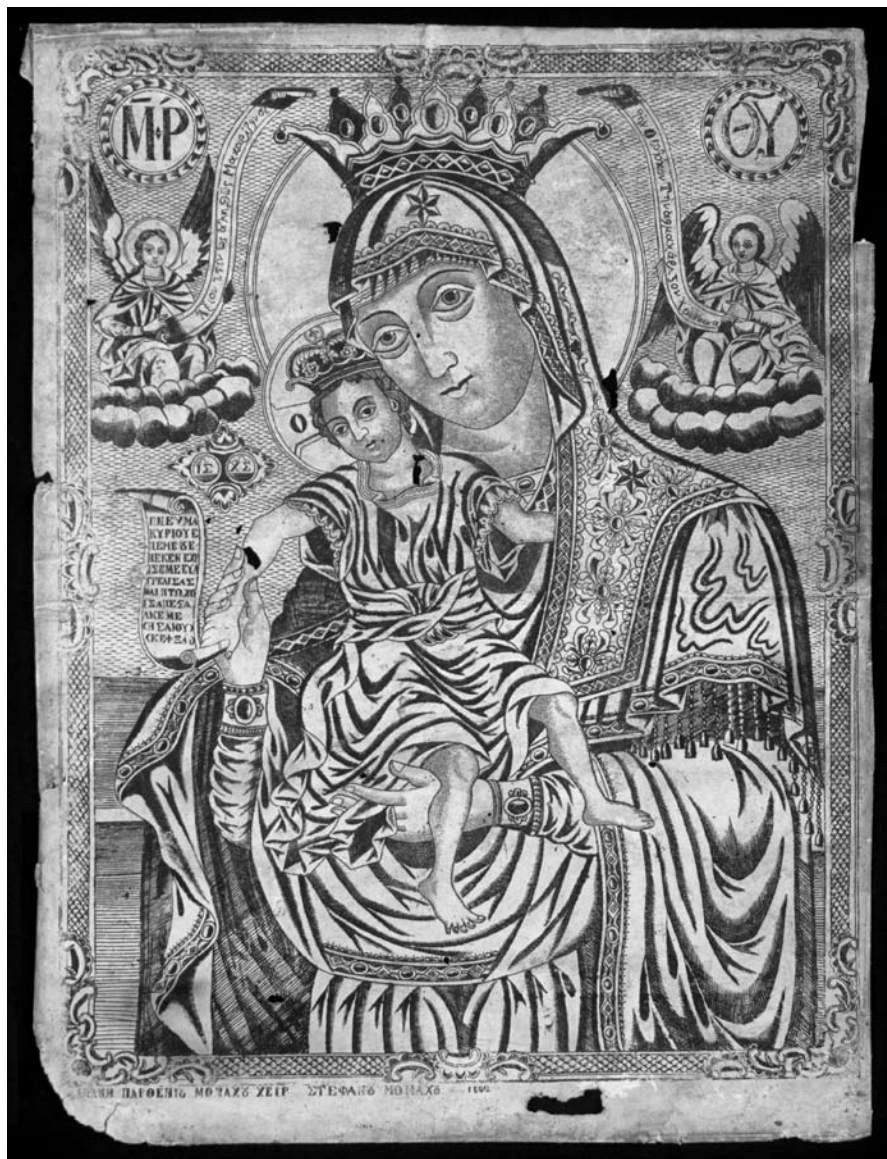
Лл. 1. Гравюра Образу Пресвятої Богородиці «Достойно Є» із зібрання Ізмаїльського історико-краєзнавчого музею Придунав'я. Лицьова сторона твору до реставрації