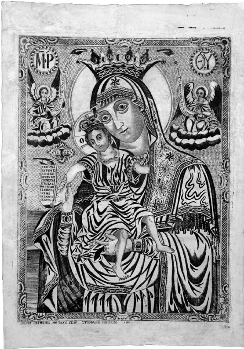
Пл. 4. Гравюра Образу Пресвятої Богородиці «Достойно Є» із зібрання Ізмаїльського історико-краєзнавчого музею Придніав'я. Лицьова сторона твору після реставрації