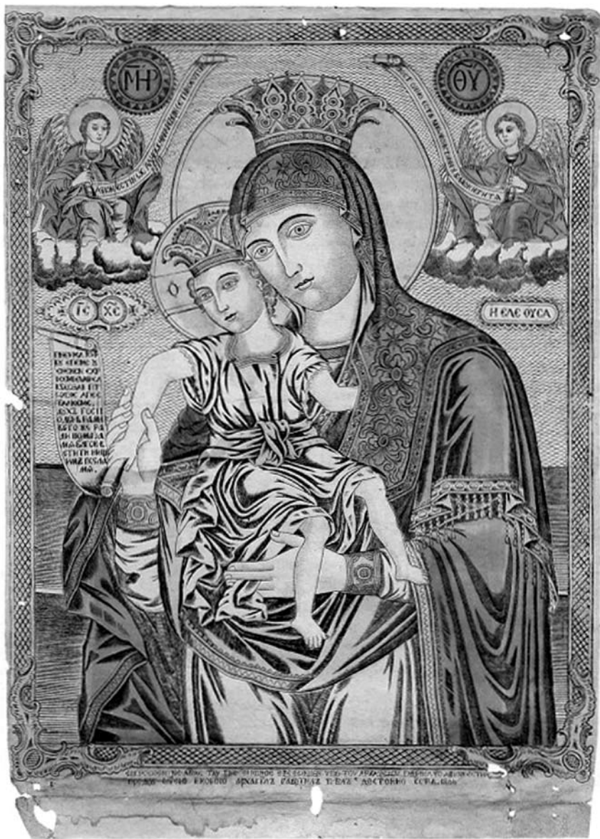
Іл. 5. Кольорова гравюра Образу Пресвятої Богородиці «Достойно Є» із зібрання монастиря Симонопетра на Афоні. 1866 р.