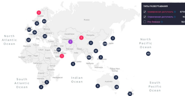
Рис. 2. Поширення мережі 5G (Європа, Азія, Африка та Австралія станом на травень 2020 року)

оцифрування транспорту, сільського господарства, виробничої та інших фізичних галузей. Розглянемо також будівельні майданчики, шахти, нафтові випробування та флотильні вантажі: ці галузі отримали б велику користь від надшвидкої передачі даних чутливого до часу виходу їх продукції.