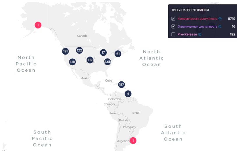
Рис. 3. Поширення мережі 5G (Північна та Південна Америка станом на травень 2020 року)

5G має потенціал для досягнення прогресу в галузі розумної техніки, а також розумного виробництва. Думаючи, що ще більше, 5G може дозволити IoT зробити практично миттєвий аналіз трафіку, покращити безпеку та громадську безпеку та, можливо, забезпечити віддалену операцію.