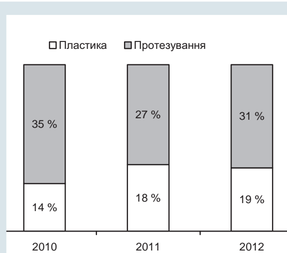
Рис. 1. Розподіл хворих з мітральною недостатністю за видом виконаного оперативного втручання в різні роки

окремо двох порожнистих вен. Використовували помірну гіпотермію (28 °С) і холододу калієво-крово'яну кардіоплегію. Доступи до МК – транссептальний і через ліве передсердя. Пластичну корекцію МК виконано 51 (35,4 %) пацієнтів, протезування МК – 93 (64,6 %) хворим. Розподіл пацієнтів за операціями пластики і протезування МК у різні роки наведено на рис. 1.