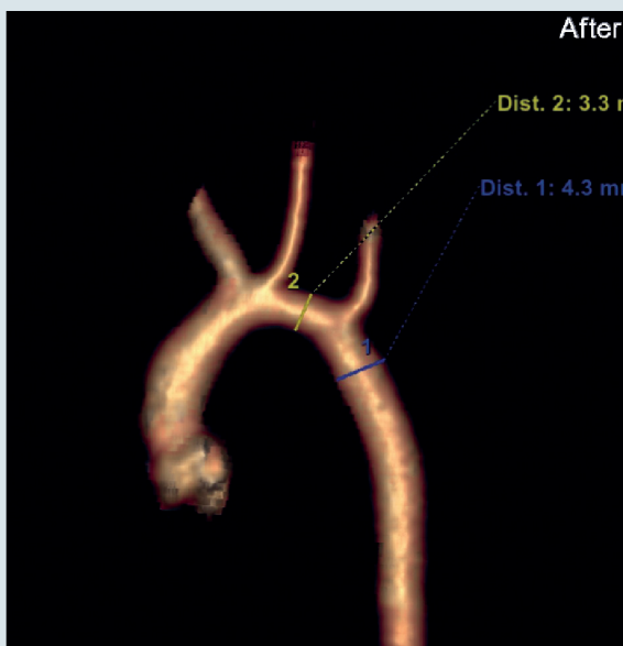
Рис. 4. Спиральная компьютерная томография: 3D реконструкция аорты после операции. 1 – сегмент аорты А, 2 – сегмент аорты В