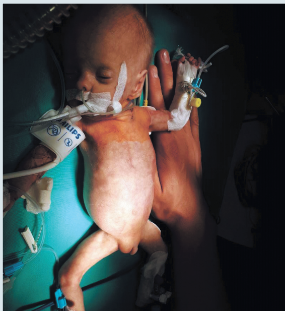
Рис. 2. Пациент после доставки в операционную