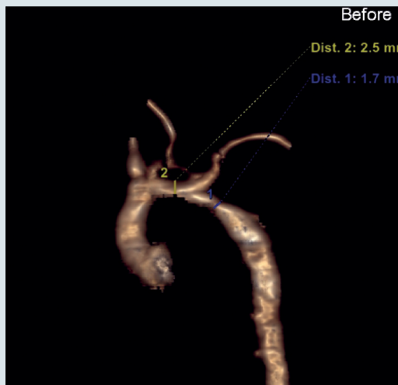
Рис. 1. Спиральна комп'ютерна томографія: 3D реконструкція аорти до операції. 1 – сегмент аорти А, 2 – сегмент аорти В