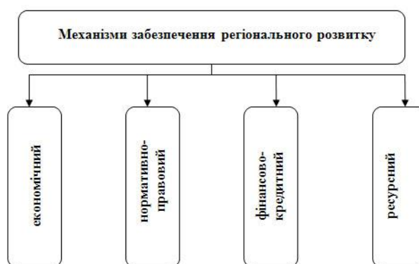
Рис. 1 – Механізми забезпечення регіонального розвитку

Доцільним буде виділити наступні механізми забезпечення регіонального розвитку, які наведені на рисунку 1.