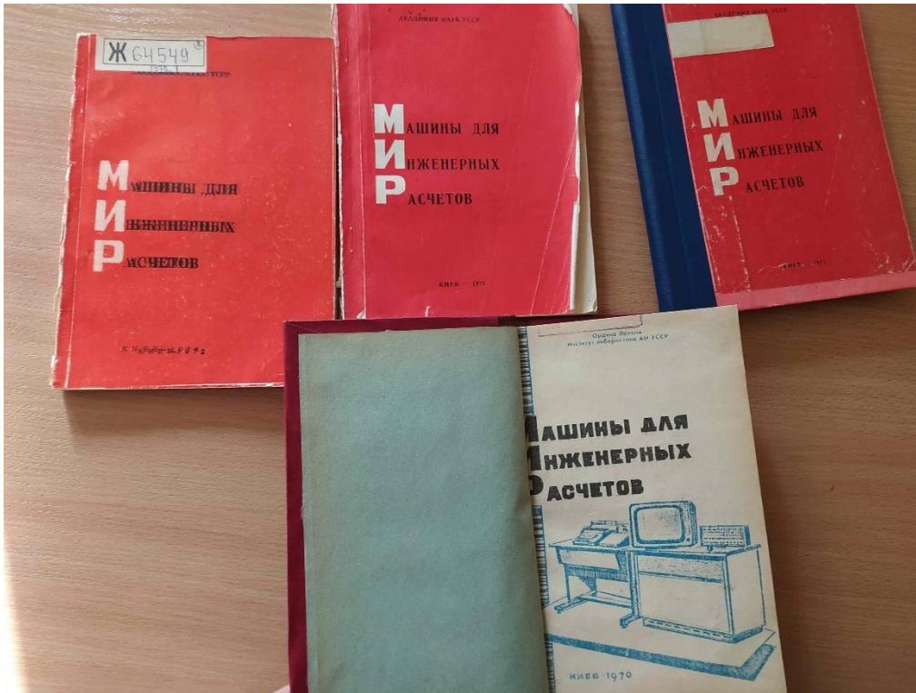
РИС. 2. Збірники Асоціації, які розсилалися організаціям – членам Асоціації

Асоціація в особі команди з базової організації (Інституту кібернетики) працювала дуже активно: видання та розсилка збірників праць членів асоціації; проведення конференцій та шкіл для навчання та обміну досвідом (до 40 на рік); щомісячні семінари; телефонні та поштові консультації. Члени Асоціації працювали на громадських (волонтерських) засадах, лише вчений секретар З.В. Богемська отримувала півставки як редактор збірників праць членів Асоціації [39, 40] (рис. 2).