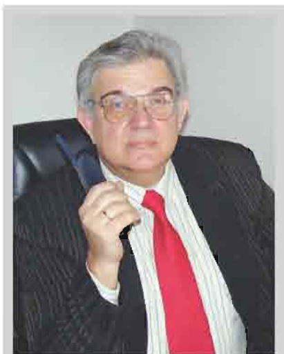
С.А. Мисяк 1 , Л.В. Ломако 2 , С.А. Рогожа 3