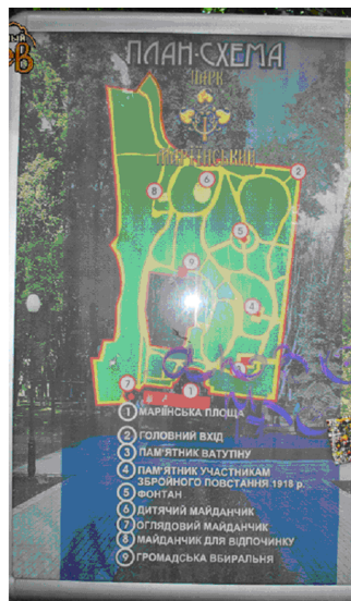
Рис. 2. Постер-карта Феофанійського парку на вул. Акад. Лебедєва, 1 (зліва) та лайтбокс-план Маріїнського парку по вул. Грушевського, 5 (зправа)