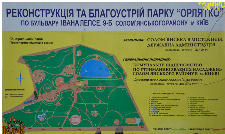
Рис. 4. Карта-схема парку «Орлятко»

Найбільш грамотним укладеним картографічним постером в м. Києві є план парку «Орлятко» у Відрадному – рис. 4.