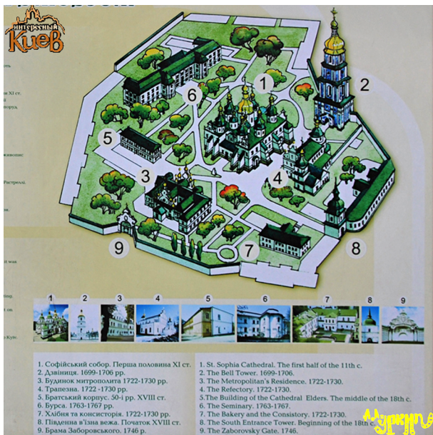
Рис. 6. Постер-карта Національного заповіднику «Софія Київська»