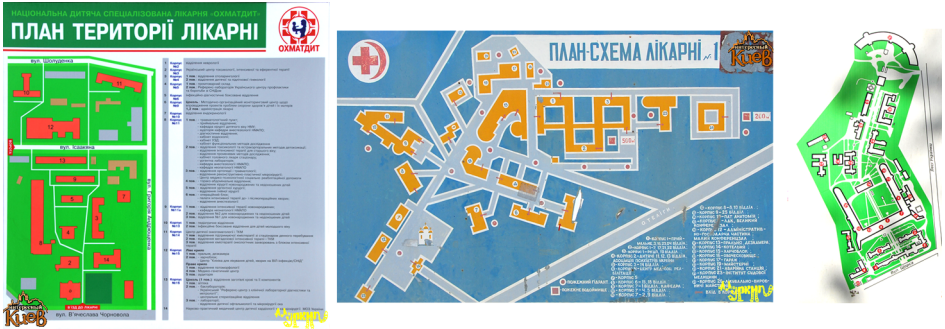
Рис. 8. Вуличні карти-схеми розташування будівель медичних закладів м. Києва

території, зелена зона та схеми проїздів тощо. У цілому вуличні карти є наочними, генералізованими і правильними, що укладені у переважній більшості за результатами космічного зондування м. Києва. Також необхідно вивчити територіальний розподіл вуличних карт на території м. Києва. За результатами польових досліджень восени 2010 р. визначена приблизна кількість вуличних карт – біля 200, їх географія та районний розподіл за визначеною типізацією і презентовані