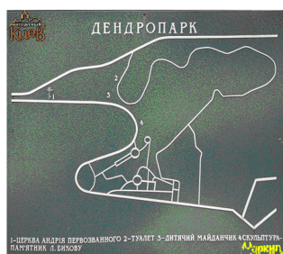
Рис. 3. Стінні плани парків по вул. Петрівська Алея (зліва) та на пл. Андрія Первозванного (зправа)

із картами, які представлені на рис. 2 можна зробити висновок про довільну орієнтацію відносно сторін Світу на планах парку Аскольдової Могили та Дендропарку, на відміну від яких плани Феофанії та Маріїнки точно орієнтовані на Північ. Фактично плани на рис. 3 є незручними для туристів, які не обізнані в територіальних особливостях ур. Угорського та Печерська, дерозкинуті парки, тобто не врахована топографічна ондуляція рельєфу, а також на плані (Дендропарку) не показана: Микільська католицька церква, пам'ятник угорцям та Героям Крут тощо. Таким чином вони є неповними, не сучасними та зовсім не відповідають ознакам туристичних вуличних картографічних зображень. Фактичним призначенням яких є показ закладів ресторанного бізнесу та в цілях транспортної логістики.