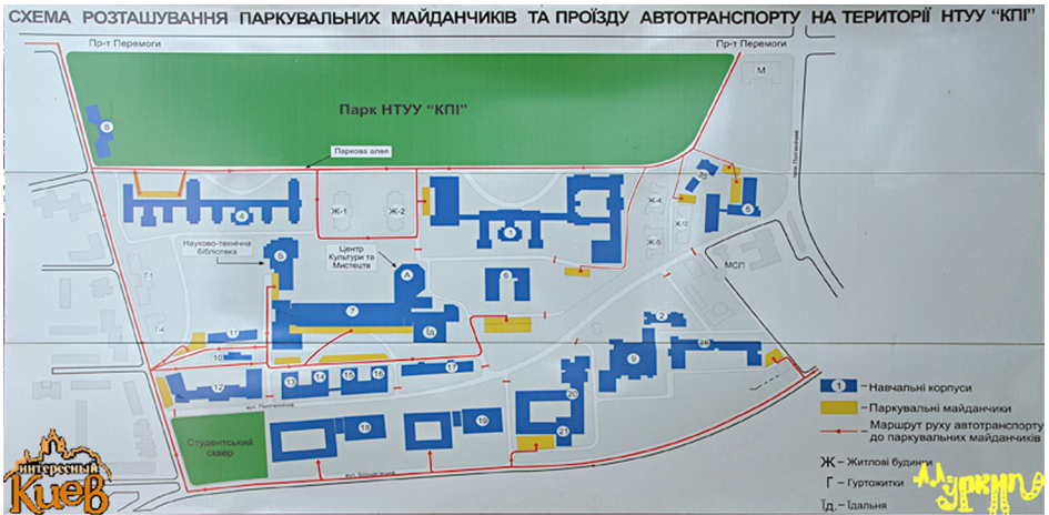
Рис. 5. Навігаційна схема Університетського містечка КПІ

зона закладу, гуртожитки та житлові будинки навколишніх масивів. Нанесена соціально-розважальна інфраструктура: бібліотека, центр культури та мистецтв КПІ, проведена експлікація забудованої території. Традиційним також є кольорова диференціація службової специфікації використання будинків містечка.