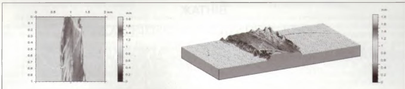
Рис. 2 – Лазерне сканування геометричної структури вовняного волокна після водної обробки