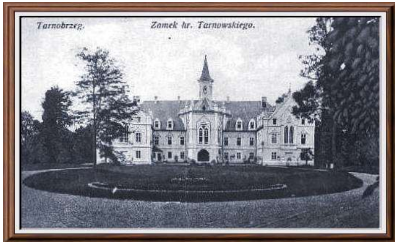
Палац Тарновських у Дикові, поч. XX ст.