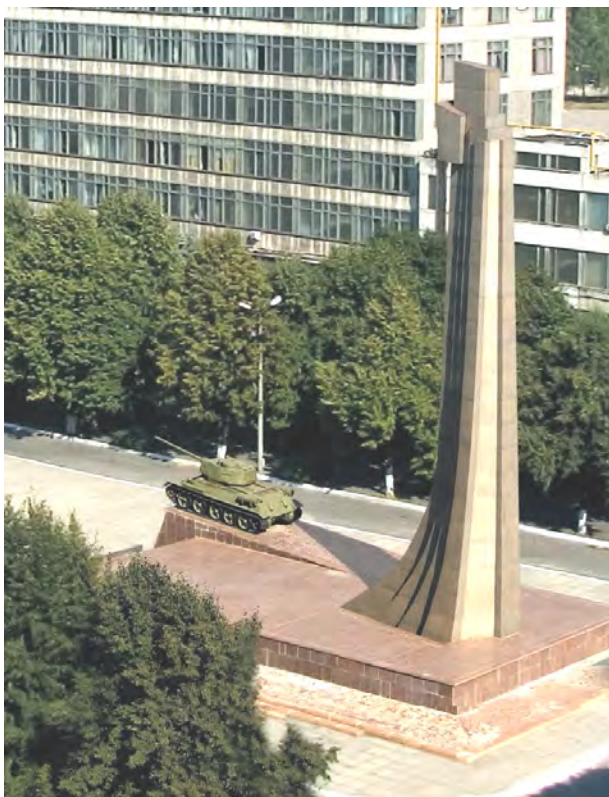
ГП «ХКБМ» им. А.А. Морозова

Поэтому использование научного потенциала ХПИ для решения проблем создававшейся в начале 20-х годов прошлого столетия бронетанковой отрасли было логичным и обоснованным. И поэтому, с усложнением бронетанковой техники росла потребность и в подготовке кадров, и во все более тесном сотрудничестве науки и производства. Это привело к созданию в структуре ХПИ сначала специальности, а затем в 1972 году и кафедры колесных и гусеничных машин.