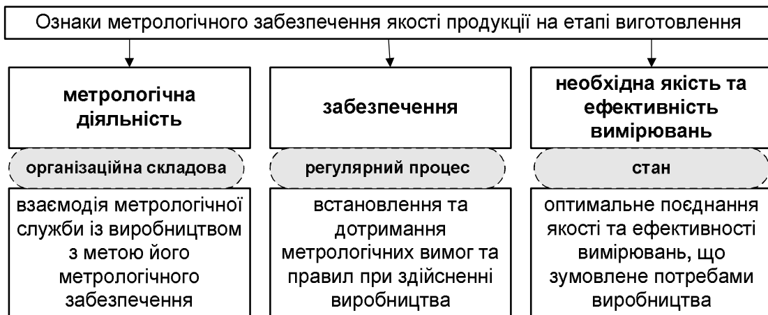
Рис. 2. Структура ознак метрологічного забезпечення якості продукції на етапі виготовлення

– систематизувати вимоги до МЗ як складної організаційно-технічної системи, основною метою якої є забезпечення необхідної якості продукції;