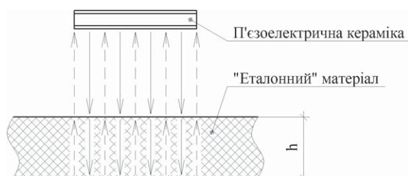
Рис. 1. Тракт відбиття пакету акустичних коливань у загальному виді

Спочатку припустимо, що досліджуваний матеріал має однорідну внутрішню структуру. Розглянемо спочатку падіння на такий матеріал пакету акустич-