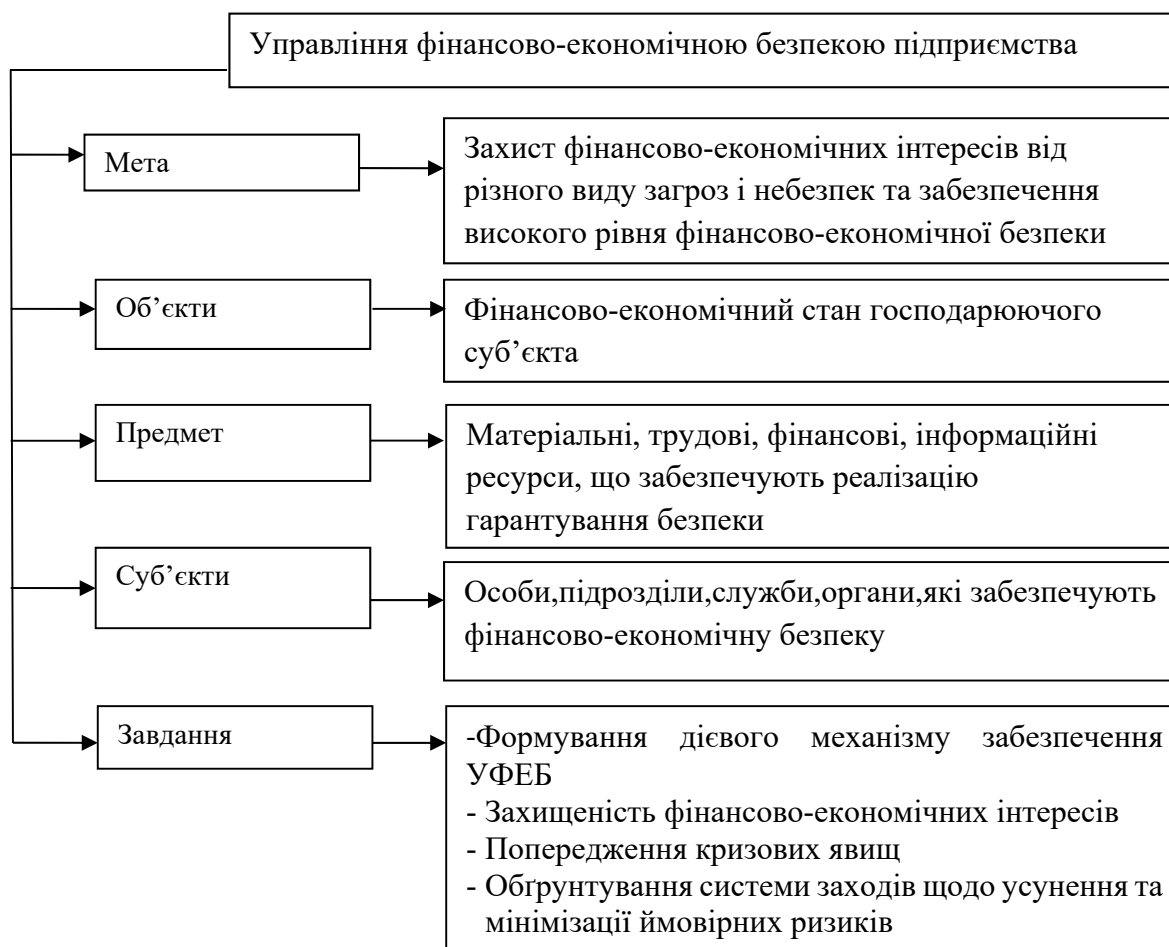
Рис. 1. Узагальнені складові управління фінансово-економічною безпекою підприємства [2]