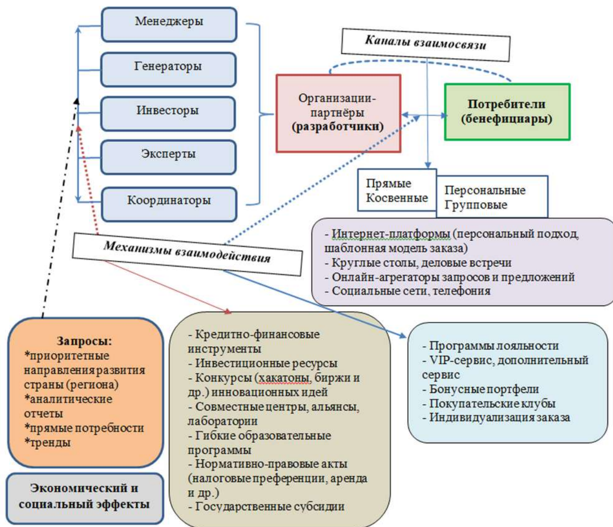
Рис. 3. Межрегиональная научно-образовательная экосистема (типовой вариант)