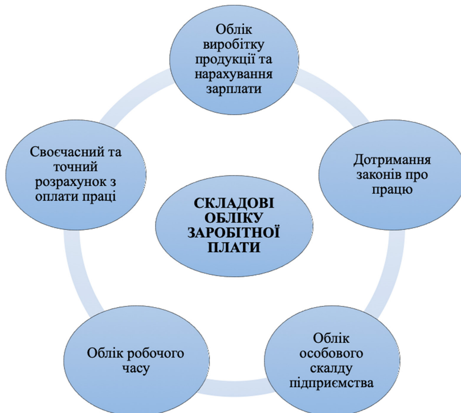
Рис. 3. Складові обліку оплати праці

Організація обліку праці та її оплати є складною ділянкою роботи. Від організації обліку оплати праці залежить якість, правдивість, справедливність, повнота і своєчасність розрахунків з персоналом з оплати праці, формування собівартості продукції та кінцевого фінансового результату діяльності суб'єкта господарювання. Бухгалтерський облік витрат на оплату працівників повинен не тільки відображати дотримання особистих інтересів працівників, але й держави. Тому надзвичайно важливим є обґрунтований підхід до формування облікової політики щодо витрат на оплату праці. У Наказі про облікову політику підприємства мають бути відображені такі основні елементи як: форми і системи оплати праці; порядок створення резервів на виплату відпусток; методи стимулювання; форми кадрової документації та документування операцій з оплати праці; субрахунки та аналітичні рахунки.