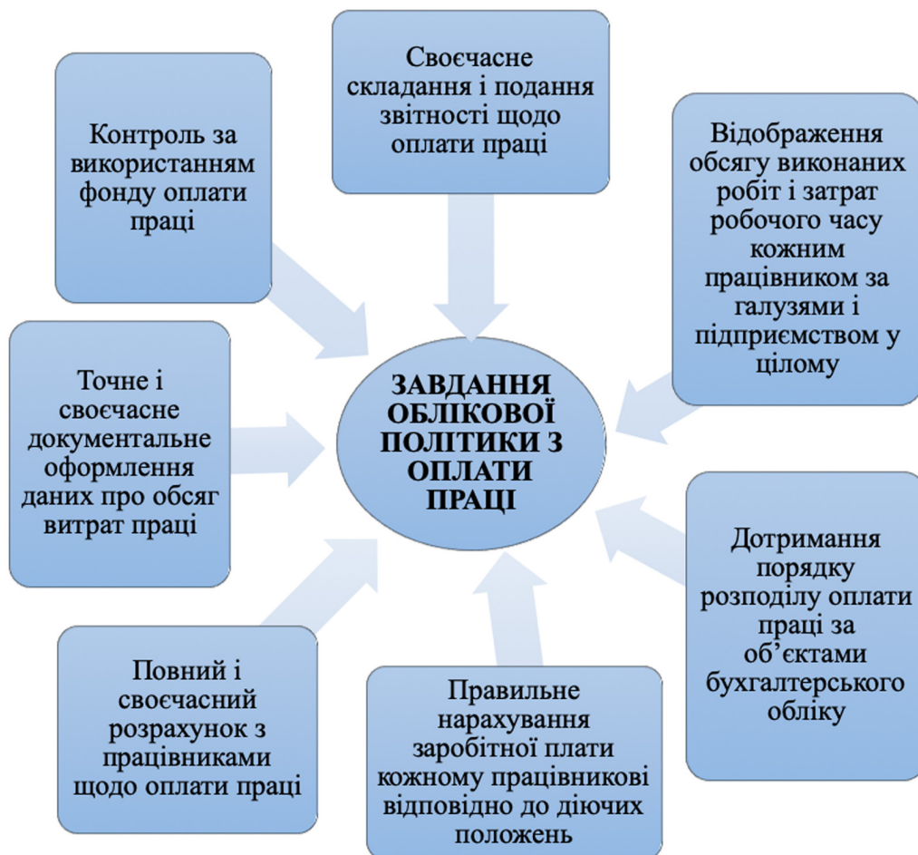
Рис. 2. Завдання формування облікової політики в частині оплати праці