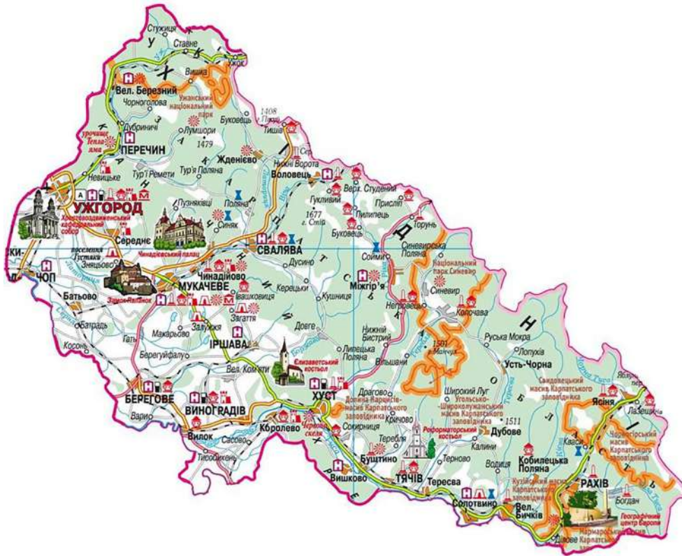
Рис. 1. Детальна туристична мапа культурних і історичних локацій Закарпаття [12]

доступністю відпочинку за кордоном, зростанням вимог туристів до комфорту проживання, якості обслуговування, включаючи медичні послуги, якості транспортних засобів та доріг. Натомість після початку російсько-української війни, обмеження можливостей для виїзду чоловіків за кордон в Закарпатті знову відмічається суттєве зростання кількості українських туристів на тлі різкого зниження туристичних потоків з-за кордону.