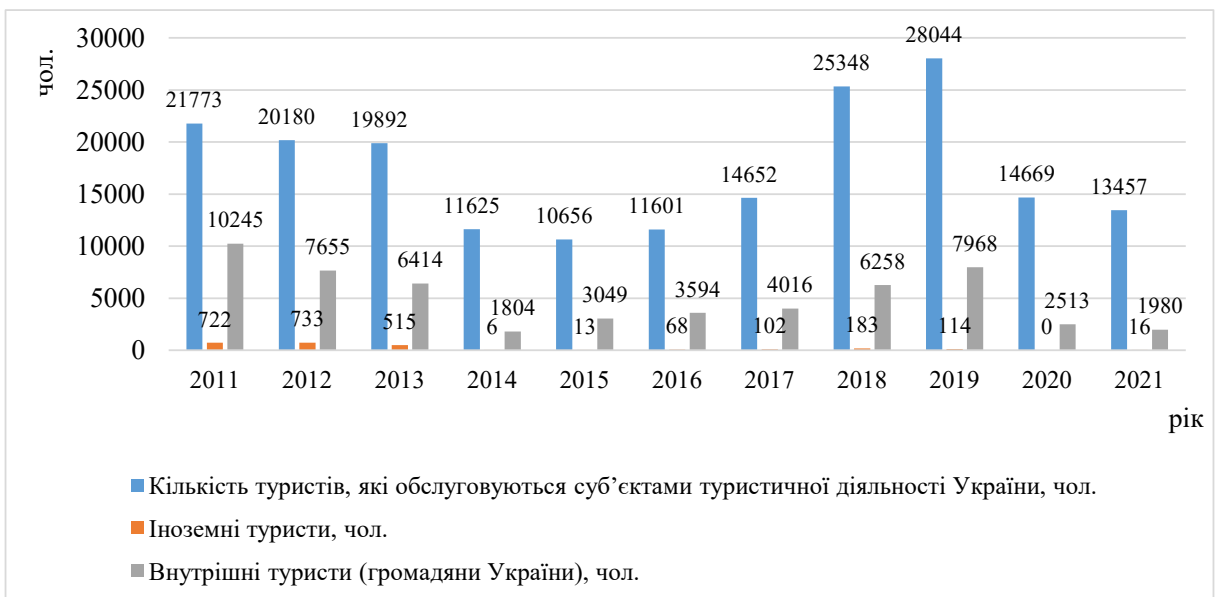
Рис. 2. Аналіз туристичних потоків в Закарпатті у період 2011–2021 рр., осіб [12]

В Закарпатті розташований географічний центр Європи, чарівна Долина нарцисів в межах Карпатського заповідника та мальовниче озеро Синевир. Окрім природних красивих місць, Закарпаття славиться своїми дерев'яними церквами, з яких вісім перебувають під охороною ЮНЕСКО. Замки, що знаходяться тут, свідчать про багату історію регіону, багато з яких колись належали феодалам і виконували роль оборонних споруд.