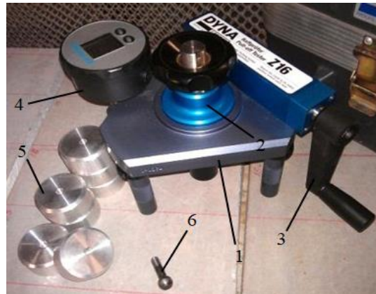
Рис. 2. Адгезиметр DYNA Z16: 1 – канвас; 2 – фіксатор; 3 – подача навантаження; 4 – манометр; 5 – випробувальний диск відривач \varnothing 50 мм; 6 – М8

В якості бетонної підкладки використовувались еталонні бетонні плити розміром 450 \times 450 \times 45 мм, виготовлені відповідно до вимог стандарту [17], коротка специфікація наведена у табл. 1.