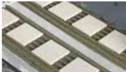
Рис. 2. Підготовлені до випробування показника адгезії еталонні бетонні плити з нанесеним ремонтним композитом та приклеєними керамічними плитками

Для дослідження адгезійних показників за [13] зразки-полоси ремонтного композиту наносились шпателем з квадратними зубцями 6 \times 6 мм на попередньо підготовлені бетонні плити з максимальною товщею матеріалу 10 мм. Після нанесення композиту до нього приклеювались керамічні плитки згідно з [20], на яких розміщувались металеві відривачі адгезиметру (рис. 2).