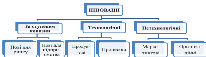
Рис. 2. Класифікація інновацій

Інновації часто залежать від зовнішніх потоків інформації: інформаційного обміну між підприємствами, створення загальних лабораторій, дослідницьких центрів, венчурних підприємств, залучення науково-дослідних організацій до освоєння інновацій, участі у професійних співтовариствах, інформації про ринок, споживачів, постачальників, конкурентів. На практиці,