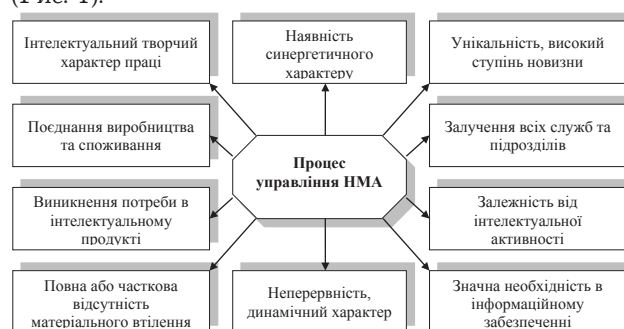
Рис. 1. Основні характеристики процесу управління нематеріальними активами підприємства

Г.В. Жаворонкова, В.О. Жаворонков, Д.М. Соковніна, Л.Ю. Мельник та М.О. Гоменюк [2] виділяють цілу низку особливостей процесу управління нематеріальними активами, якими не варто нехтувати при організації даного процесу на підприємстві (Рис. 1).