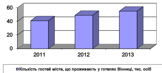
Рис. 1. Економічна складова проживаючих у готелях міста

Щодо туристичних потоків на Вінниччині, економічна складова туристичної галузі за 2013 рік показала стабільний розвиток. Збільшилася кількість туристів і екскурсантів, з'явилися нові туристичні послуги. Систематично збільшується кількість гостей міста, (рис. 1.), що проживають у готелях (2011 рік – 41 тис., 2012 рік – 49 тис., 2013 рік – 55 тис. осіб).