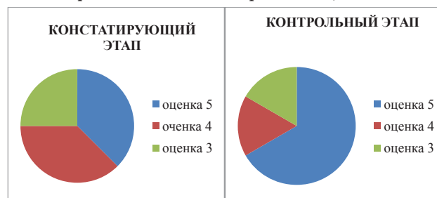
Рис. 1, 2. Сравнение уровней усвоения лексического аппарата у детей дошкольного возраста на констатирующем и контрольном этапе эксперимента

Сравнение уровней усвоения лексических навыков представлено в диаграммах 1, 2.