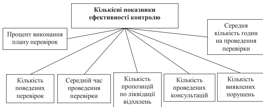
Рис. 1. Кількісні показники оцінки ефективності системи внутрішнього контролю

Висновки. Таким чином, в результаті проведеного дослідження доповнена і уточнена класифікація кількісних і якісних показників оцінки ефективності системи внутрішнього контролю, що дозволить застосовувати систематизований підхід до оцінки ефективності системи внутрішнього контролю суб'єктів господарювання.