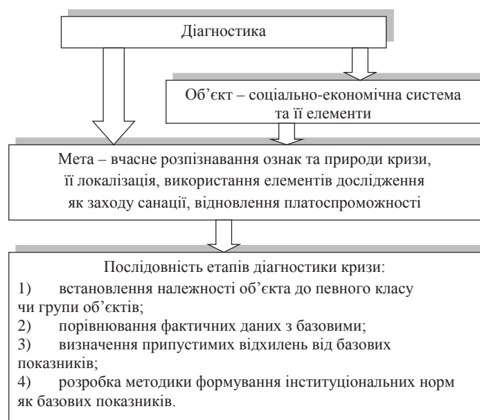
Рис. 1. Діагностика як елемент системи санаційного управління

Санаційне вирішення цих проблем може знаходитися у сфері перегляду як стратегії фірми та реструктуризації підприємства, так і її тактики, що зумовлює зниження витрат, скорочення штату управлінського апарату і робочих місць, підвищення продуктивності праці і т. ін. Однак визначити масштаб і складність проблем та запобігти їм можна тільки на стадії діагностики, визначивши цілі й методи діагностування (рис. 1).