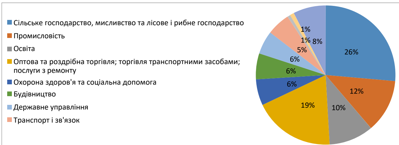
Рис 3. Сфера зайнятості населення Ужгородського району

Найбільша кількість економічного активного населення зосереджена в сільському господар-