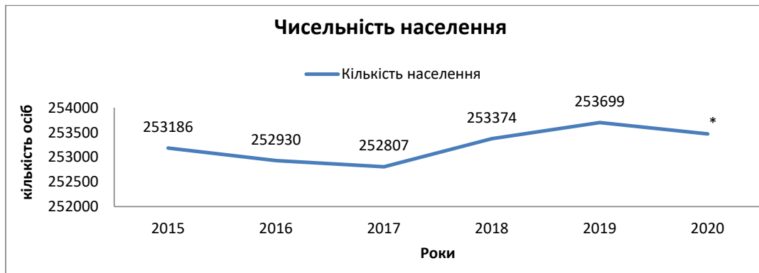
Рис 2. Чисельність населення Ужгородського району