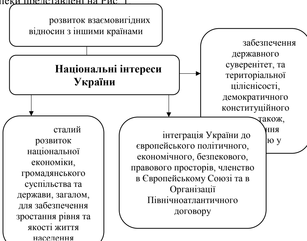
Рис. 1. Національні інтереси України щодо трансформації її місії у формуванні архітектури сучасної системи забезпечення європейської безпеки

Фундаментальні національні інтереси України щодо трансформації її місії у формуванні архітектури сучасної системи забезпечення європейської безпеки представлені на Рис. 1