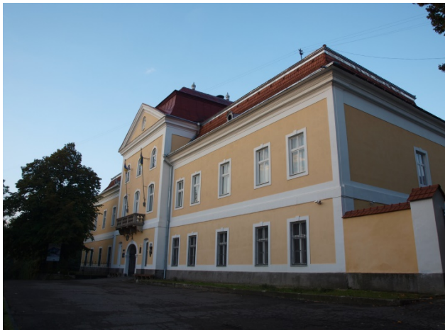
Будинок правління Ужанського комітату – тепер Закарпатський обласний художній музей ім. Й. Бокшиа

(реорганізована з Товариства діячів образотворчого мистецтва на Підкарпатській Русі у 1939 році) мав право виставляти свої роботи на 3 м 2 і щомісяця змінювати роботу. За кожен новий твір автор зобов'язувався вносити грошовий внесок у розмірі 1 пенге. Якщо робота продавалась, 12 % залишалось на користь галереї та Спілки.