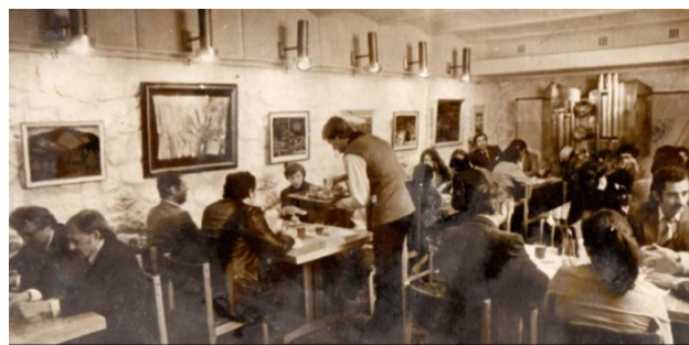
Інтер'єр клубу Форум, 1985 рік.

Початок 1980-х – неоднозначний період розвитку закарпатського мистецтва. З одного боку, це – час розквіту регламентованого мистецтва, а з іншого – пошуків творчих пошуків серед молодих художників. Кульмінацією боротьби між новим і старим мистецтвом у 1980-х роках стало відкриття «Клубу творчої молоді» – «Форум», який у 1982 році розпочав свою діяльність в кафе в історичній частині Ужгорода. У часи брежнєвського застою відкриття альтернативного виставкового простору у підвальному приміщенні стало імпульсом, що спонукав до активності творчу молодь.