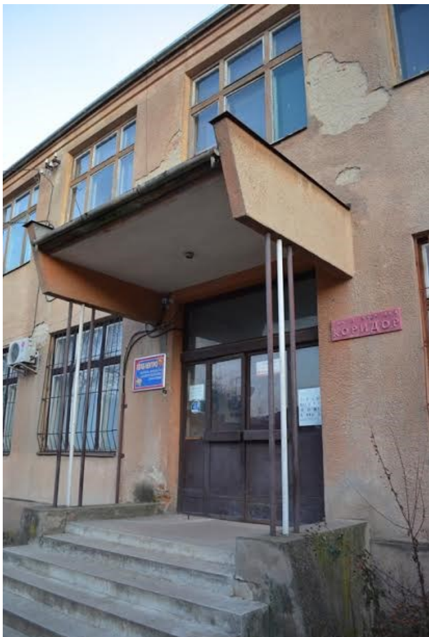
Приміщення колишнього Художфонду, де на 2-му поверсі розміщується неформальна галерея «Коридор»

у приміщенні колишнього Художфонду (вул. Пархоменка, 7) належить художнику Павлу Ковачу – учневі та ідейному послідовнику нонконформіста Павла Бедзира, де на другому поверсі знаходилась його творча майстерня. Після смерті художника у липні 2002 року, в день його народження (27.01) відбулася перша імпровізована акція, що стала точкою відліку історії неформальної галереї.