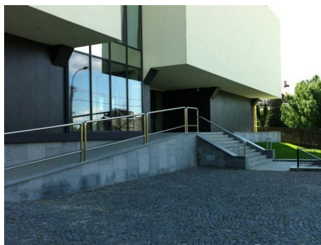
«Галерея Ілька», вул. Кошицька, 28