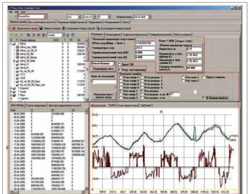
Рис. 2. Головна форма програми та закладка «Обробка замірів». Верхні два графіки – розрахований і замірний пластові тиски в області відбирання газу, а нижній – надходження (надвіско) та відбирання (нижче осі) газу

Режим роботи ПСГ розраховується для відомого початкового розподілу пластових тисків, температур і складу пластового газу на розглядуваний прогностичний період часу за заданим