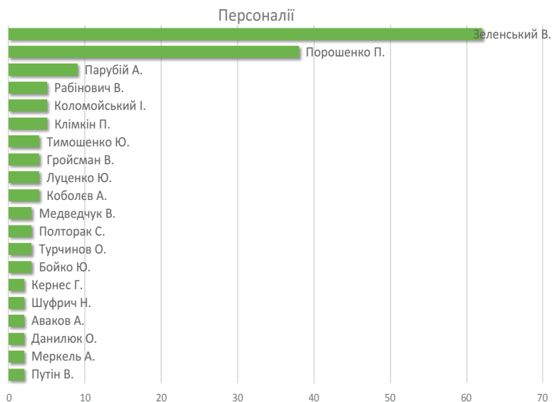
Рис. 3. Персоналії

Джерело: Громадська думка про правотворення. 2019. № 10 (175). Трав. С. 29