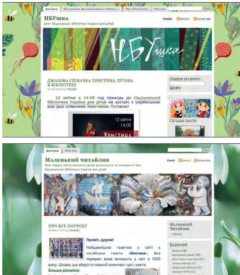
Рис. 1. Представленість блогів Державної бібліотеки України для юнацтва

Загалом вітчизняні бібліотечні представництва використовують різні фонові світлини та обкладинки бібліотечного представництва (рис. 1). Так, загалом у зарубіжних бібліотек блог є сторінкою офіційного веб-сайту, тому фонові світлина сторінок однакова, а от обкладинки різні (рис. 2).