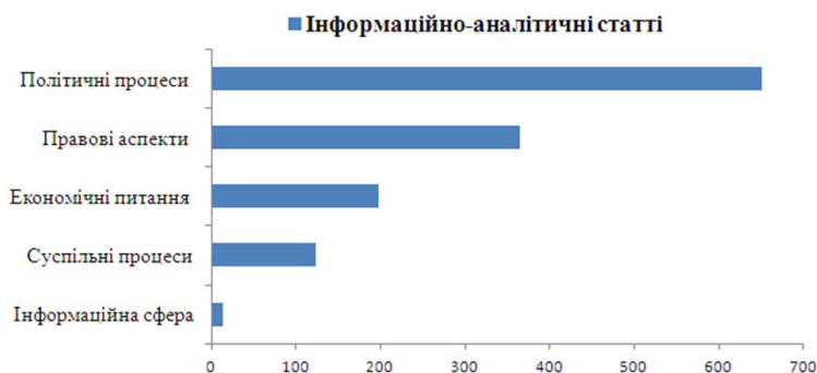
Рис. 5. Представленість інформаційно-аналітичних праць за висвітленою тематикою за 2013–2018 рр. на порталі «Центр досліджень соціальних комунікацій»

Отже, географічний зріз аудиторії порталу «Центр досліджень соціальних комунікацій» (за допомогою програми Google Analytics) представив такі результати: найбільше користувачів з України (89,2 %), Росії (4,5 %), США (0,94 %), Німеччини (0,8 %), Польщі (0,7 %), Нідерландів (0,6 %), Великої Британії (0,31 %), Італії (0,26 %), Франції (0,25 %). Для наочності наведемо візуалізацію отриманих результатів (рис. 6), у яких графічно показник аудиторії порталу варіюється від меншої до більшої кількості (світлий – темний колір).