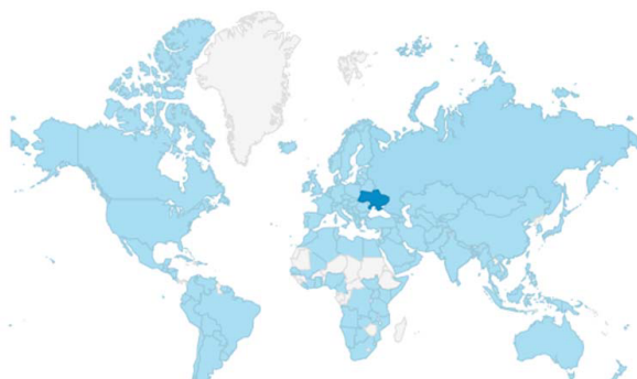
Рис. 6. Аудиторія за географічною складовою порталу «Центр досліджень соціальних комунікацій»

хідність створення мобільної версії порталу, яка є ефективним каналом комунікації з користувачами.