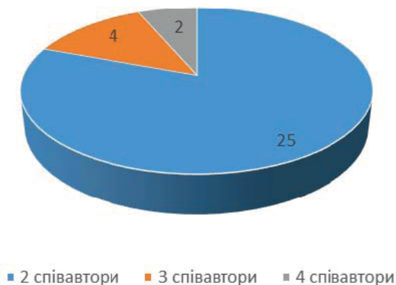
Рис. 2. Розподіл публікацій за кількістю співавторів

Зазначимо, що всі види співавторства засвідчують високий рівень наукової комунікації у різних аспектах бібліотечно-інформаційної сфери, але поки міжнародне співробітництво, у межах опублікованих праць Конференції, дає підстави стверджувати про необхідність активізації професійної комунікації із закордонними партнерами. У сучасному світі