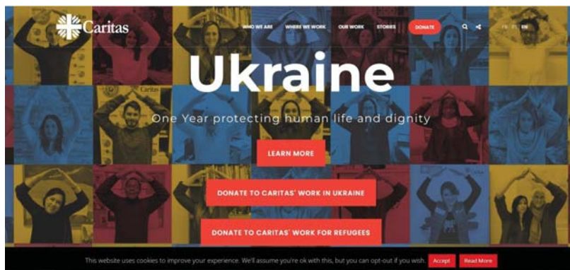
Рис. 5. Вебсторінка сайту Міжнародної конфедерації гуманітарної допомоги «Caritas Internationalis».

засоби гігієни. Згодом суму збільшили до 50 євро на сім'ю з трьох осіб. За потреби кожні 15 днів біженці можуть отримувати нову картку. Основною умовою є надання чеків, а розраховуватися цими картками можна лише у спеціальних двох супермаркетах, з якими Caritas має домовленість про реалізацію карток [6, с. 83].