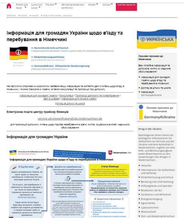
Рис. 4. Вебсторінка сайту уряду землі Нижня Саксонія ФРН «Інформація для громадян України».

На спеціально створених для українських біженців сайтах німецьких федеральних земель розміщуються файли з нагальними запитаннями та відповідями про в'їзд і перебування в Німеччині, через що біженцю простіше орієнтуватися у змінах нормативно-правової бази держави перебування і можливостях отримання різноманітної підтримки. Зокрема, на сторінці уряду землі Нижня Саксонія ФРН (URL: https://www.niedersachsen.de/ukraine/ ) розміщено найважливішу інформацію з питань щодо в'їзду в Німеччину (Нижню Саксонію), контактні відомості та можливості консультативної допомоги для українців (рис. 4).