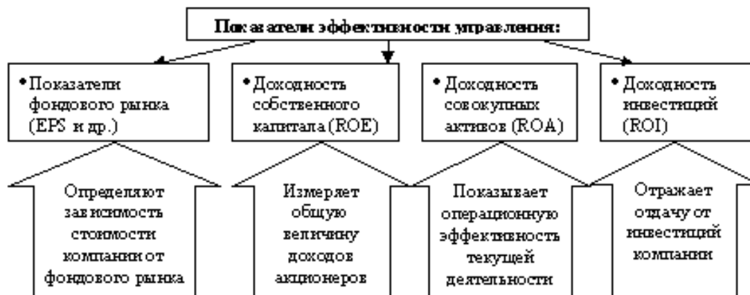
Рис. 2. Показатели эффективности управления

Таким образом, каждому уровню менеджмента соответствуют свой набор коэффициентов и пределы их изменения за определенный период. Однако простое выявление факторов стоимости не обеспечивает решения задачи тотального управления деньгами – необходимо их увязать с показателями, на основании которых принимаются функциональные и оперативные решения на всех уровнях управления.