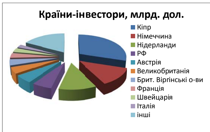
Рис. 1. Основні інвестори України на 2014 р.

Більша частина інвестицій припадає на українську промисловість – 14,817 млрд. дол., або 32,3 % прямих інвестицій, а також на установи фінансової і страхової діяльності – 11,537 млрд. дол., або 25,1 %, підприємства оптової і роздрібної торгівлі, ремонту автотранспортних засобів і мотоциклів – 6,019 млрд. дол., або 13,1 %, організації з роботи з нерухомістю – 3,804 млрд. дол., або 8,3 %, наукові і технічні організації – 2,837 млрд. дол., або 6,2 % (рис. 2).