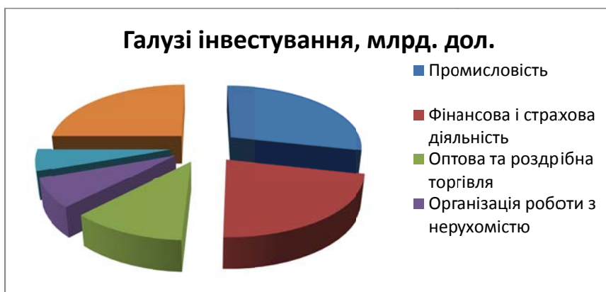
Рис. 2. Пріоритетні галузі іноземного інвестування в Україну 2014 р.

Більша частина інвестицій припадає на українську промисловість – 14,817 млрд. дол., або 32,3 % прямих інвестицій, а також на установи фінансової і страхової діяльності – 11,537 млрд. дол., або 25,1 %, підприємства оптової і роздрібної торгівлі, ремонту автотранспортних засобів і мотоциклів – 6,019 млрд. дол., або 13,1 %, організації з роботи з нерухомістю – 3,804 млрд. дол., або 8,3 %, наукові і технічні організації – 2,837 млрд. дол., або 6,2 % (рис. 2).