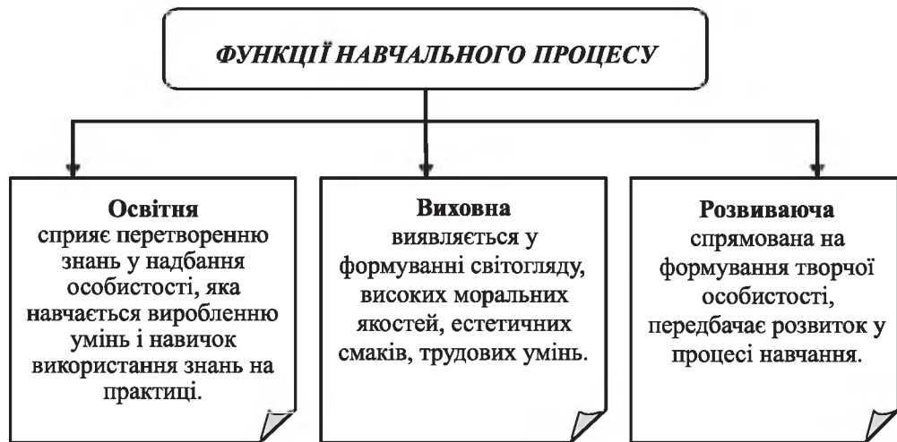
Рис. 2. Функції навчального процесу в системі якості освіти

Таким чином, навчальний процес як складова частина загального виховання всебічно розвиненої сучасної особистості повинен забезпечити виконання пізнавального завдання реалізацією трьох функцій, основними з яких є освітня, виховна і розвиваюча (рис. 2).