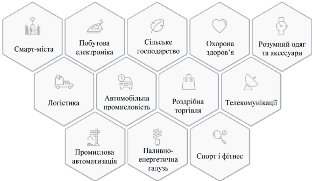
Рис. 1. Галузі, сектори та сфери, у яких найчастіше використовується Інтернет речей

Враховуючи сутність і характер IoT, цю технологію в той чи інший спосіб можна використовувати практично в будь-якій галузі (рис. 1), в тому числі в сфері логістики.