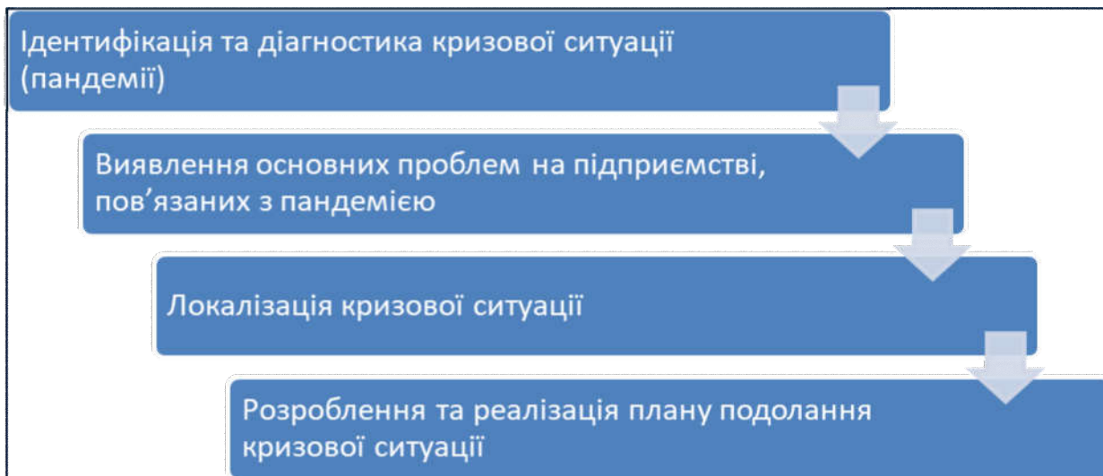
Рис. 3. Алгоритм антикризового менеджменту в готельно-ресторанному бізнесі в період пандемії

Антикризове управління – це цілий комплекс дій, до яких будуть залучені можливо всі працівники підприємства, проте керівнику слід сформувати антикризову команду з кількох провідних фахівців, які відповідальні за розроблення та реалізацію цього плану. В управлінні кризовими ситуаціями на підприємствах готельно-ресторанного бізнесу в період пандемії пропонуємо розрізняти послідовні етапи дій (рис. 3).