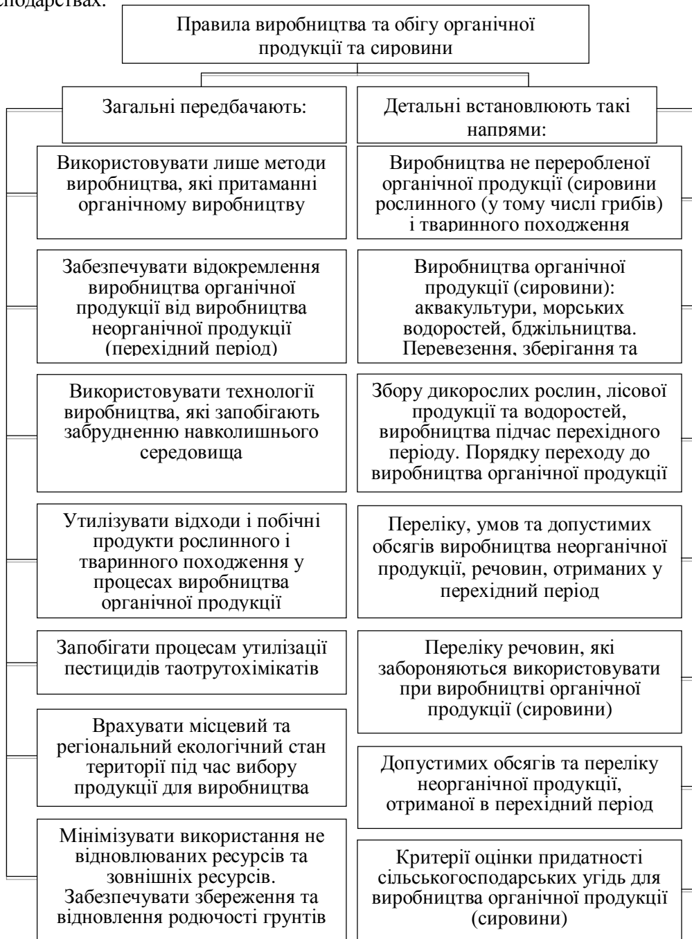
Рис. 2. Взаємозв'язок загальних і детальних правил виробництва та обігу органічної продукції та сировини

консервантів тощо). Безумовно, зміни у веденні аграрного виробництва можуть сформувати певні умови для налагодження органічного виробництва у цих господарствах.