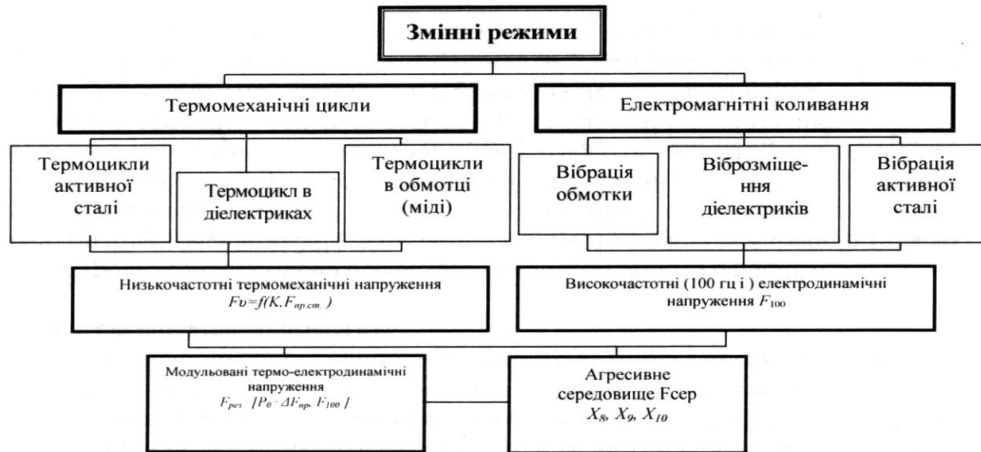
Рис.1. Причинно-наслідкові фактори впливу на надійність СТС

Керуючись різномірними ( в тому числі теоретичними і емпіричними) масивами даних в динаміці, враховуючи їх нелінійність і неповноту, вирішувати задачу контролю і управління індивідуальною надійністю СТС існуючими, класичними методами і засобами практично неможливо. Пропоновану модель розв'язку представимо у вигляді інтелектуальної моделі [2,3]. Основу моделі складають формалізовані за допомогою теорії нечітких множин лінгвістичні висновки, які базуються на інформації з нормативно-технічної документації, аналізу фізичної суті процесів та наявних результатів експериментальних і теоретичних досліджень (Рис. 1.)