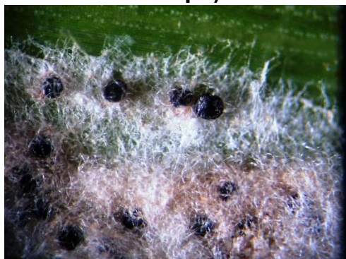
Рис. 3. Клейстотеції збудника борошнистої роси пшениці озимої (×20)