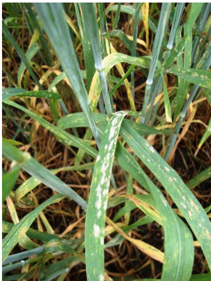
Рис. 1. Симптоми борошнистої роси на пшениці (сорт Національна, 2012 р.)