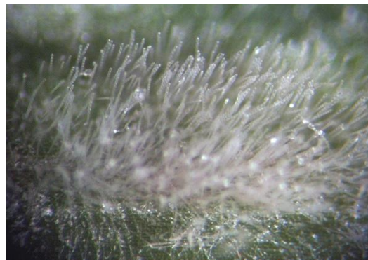
Рис. 2. Подушечка конідиального спороношення Erysiphe graminis f. sp. Tritici на листку пшениці (×20)