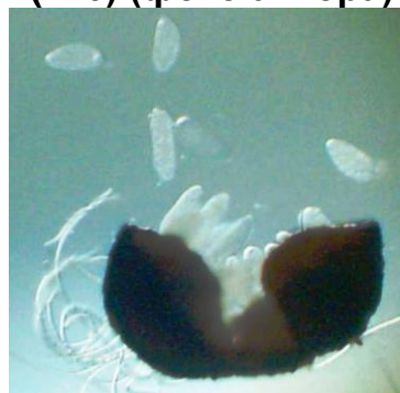
Рис. 4. Вихід сумок з клейстотецію (×100)

Рослини для дослідів вирощували в клімокамері. У фазу другого листка проводили їх інокуляцію суспензією свіжозібраних конідій Erysiphe graminis f. sp. tritici . Інфекційний матеріал збирали з уражених рослин на дослідних полях ВП НУБіП України «Агрономічна дослідна станція».