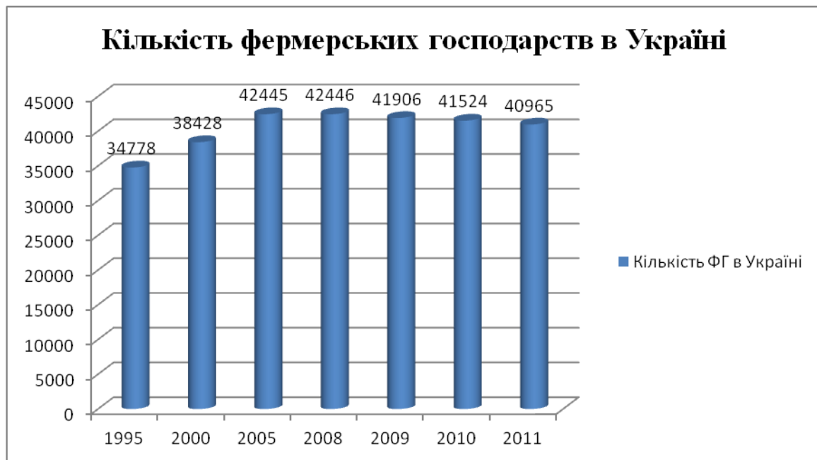
Рис. 2. Динаміка кількості фермерських господарств в Україні за період з 1995 до 2011 року

Динаміка кількості фермерських господарств протягом аналізованого періоду їх функціонування була нерівномірною. Високі темпи росту кількості фермерських господарств мали місце в період до 2008 року. У подальшому відбулося уповільнення темпів зростання кількості фермерських господарств (рис. 2).