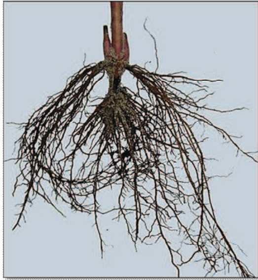
Рис. 1. Утворення коренів на двовузловому живці Clematis heracleifolia var. davidiana