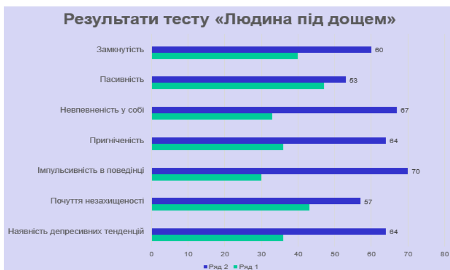
Рис. 3 Результати дослідження за рисунковим тестом «Людина під дощем»