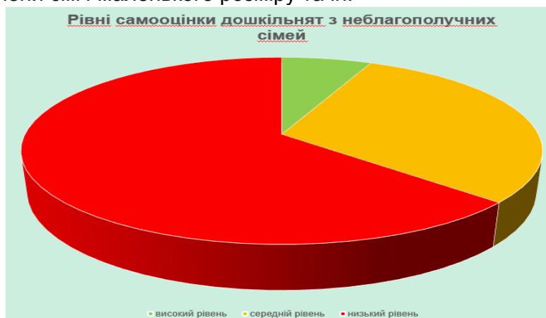
Рис.1 Результати визначення рівня самооцінки дошкільнят за методикою В. Г. Щур

Проаналізувавши отримані результати, ми можемо зазначити, що 10 дошкільнят з 75 досліджуваних живуть та виховуються в неблагополучних родинах. На малюнках дітей виявлено: відсутність членів родини, відсутність самої дитини на малюнку, присутність чорних та сірих кольорів, деякі члени сім'ї без частин тіла, присутня в малюнках агресія та зневага, члени сім'ї маленького розміру та ін.