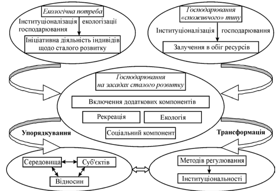
Рис. 2. Схема трансформації змісту політики господарювання

Зростання техногенного тиску виробництва на навколишнє середовище надає руйнівний вплив на його якісні параметри, не даючи змоги повною мірою відновити здоров'я та працездатність індивідів, посилюючи існуванням стихійних (неорганізованих) форм рекреації [2, с. 367]. Тому дуже важливим є формування засобів інструментального характеру для адекватної взаємодії суб'єктів господарювання в рамках виробленої політики. Логічну схему розширення змісту лісової політики наведено на рис. 2.