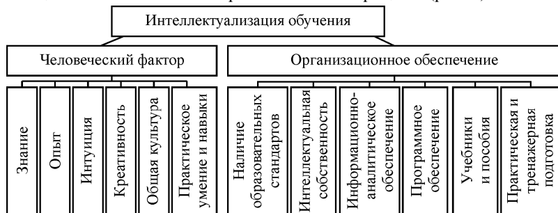
Рис. 2. Структуризация компонентов, обеспечивающих интеллектуализацию обучения

Согласно [8], интеллектуальный капитал – это система полученных знаний, использование которых приносит дополнительный доход при его рациональном потреблении в виде набора компетенций и практических навыков. Он включает в себя такие виды ресурсов, которые не поддаются традиционным оценкам состояния обучаемого, а порождаются знаниями персонала. В связи с этим автором настоящей статьи предлагается разделить получение компетенций при овладении профессиональными качествами курсантов специальности эксплуатация судовых энергетических установок на человеческий фактор и организационное обеспечение образовательного процесса (рис. 2).