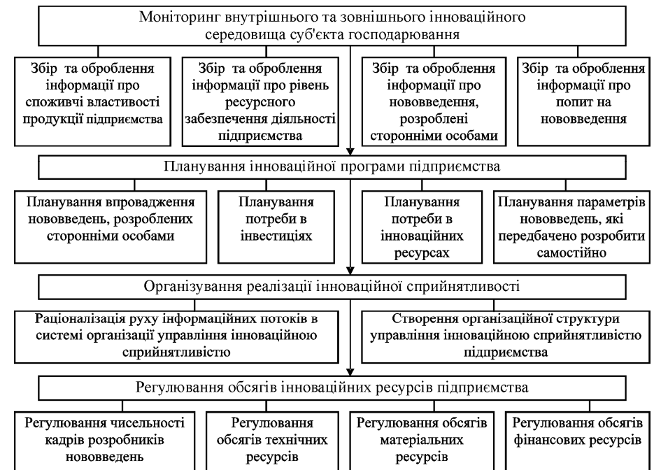
Рис. 4. Послідовність процесу управління інноваційною сприйнятливістю підприємства