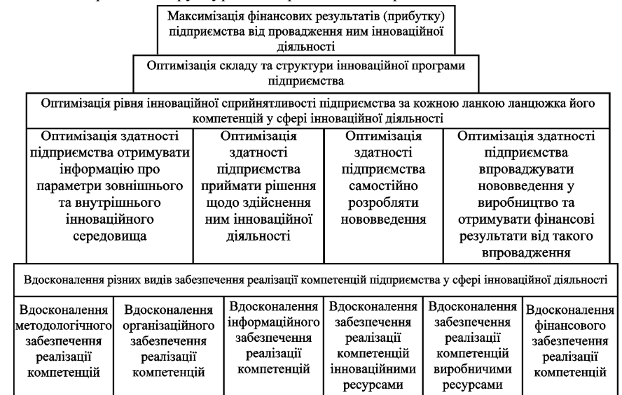
Рис. 2. Ієрархія цілей та завдань управління інноваційною сприйнятливостю суб'єкта господарювання

новаційної сприйнятливостю автор відніс: структурний механізм, інформаційний механізм, механізм прийняття рішень, механізм управління ресурсами та механізм управління інноваційним процесом. Стосовно об'єктів управління інноваційною сприйнятливостю, то, на думку автора, вони охоплюють: процеси розподілу ресурсів, процеси підготовки персоналу, процеси інформаційного забезпечення, інноваційний процес, організаційно-управлінські процеси, процеси стимулювання попиту та процеси виробничого характеру. Якщо ж розглядати суб'єкти управління інноваційною сприйнятливостю підприємства, то до них автор відніс його вище керівництво, керівники структурних підрозділів та персонал.