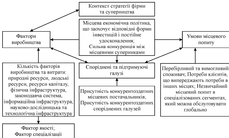
Рис. 2. Джерела локальних конкурентних переваг ("Діамант М. Портера") [4]

Детальніше модель потенціалу кластеризації подано на рис. 2 ("Діамант М. Портера") та рис. 3. (Модель "Діамант").